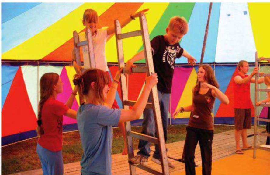
Clase de escalera acrobática durante el Intercambio Juvenil en Circo Social entre el Ateneo Popular 9Barris y Circus Circuli en Stuttgart

Por ejemplo, podríamos ver cómo una niña de 6 años conoce el circo a partir de un taller de descubrimiento que hacen los jóvenes del ateneo en una plaza del barrio. Esta niña ve que le gusta y se apunta a la actividad que ofrece el centro infantil de su barrio. Al practicarlo de forma regular se da cuenta de que es una actividad que le va bien, se siente cómoda y decide, con el consejo de sus educadores y familia, apuntarse a la Escuela Infantil de Circo. Con 13 años cumplidos decide continuar en la Escuela Juvenil de Circo; combinando los estudios formales en el instituto, decide participar